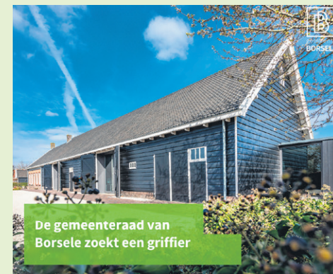
De gemeenteraad van Borsele zoekt een griffier

Nieuwsgierig geworden? Kijk voor meer informatie over deze functie op www.borsele.nl/vacaturegriffier .