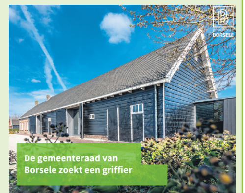
De gemeenteraad van Borsele zoekt een griffier

Nieuwsgierig geworden? Kijk voor meer informatie over deze functie op www.borsele.nl/vacaturegriffier .